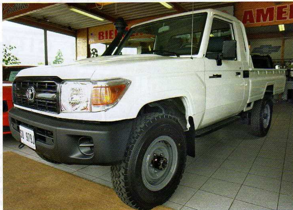
Ici, avec un pare-chocs court, d'autres modèles offrent un gros pare-chocs acceptant un treuil.