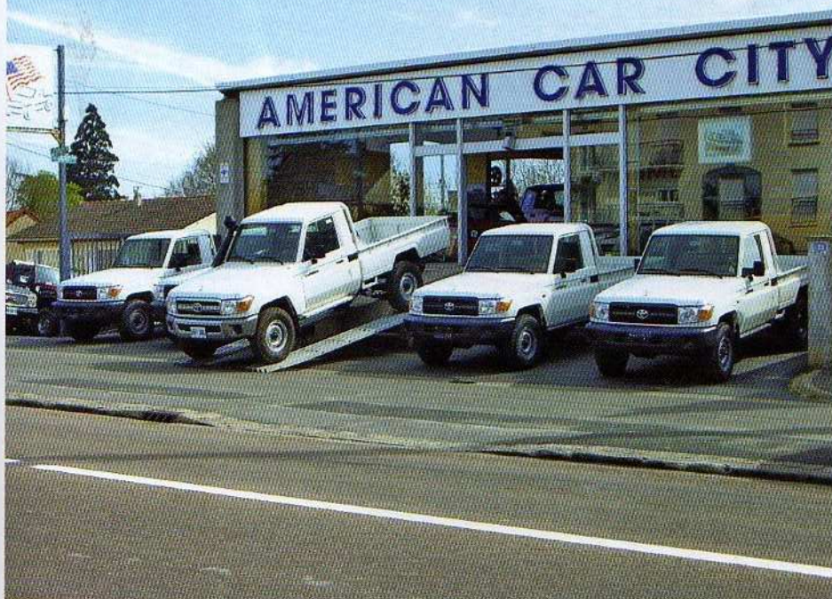
Land Cruiser HZJ79.