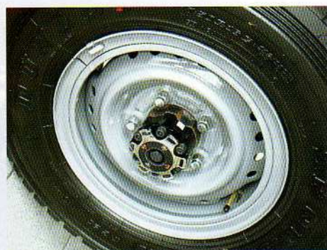
3 modèles de blocages de pont avant sont disponibles.