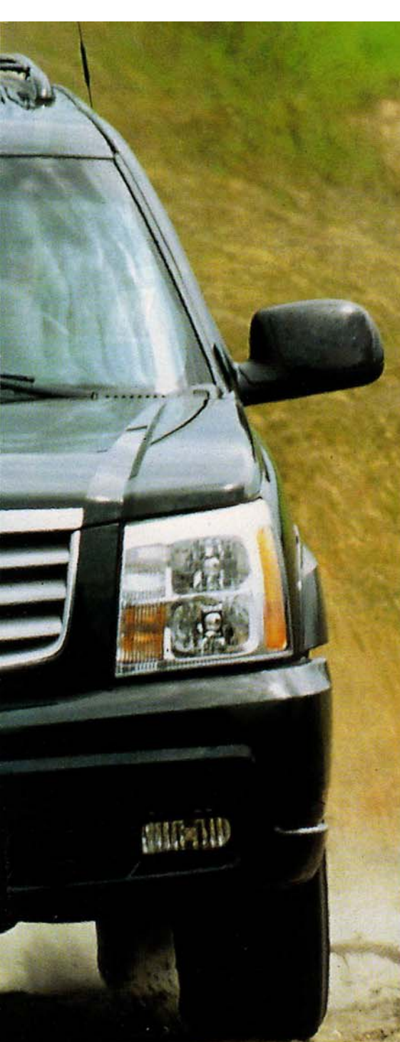
Cadillac Escalade 6.0 L